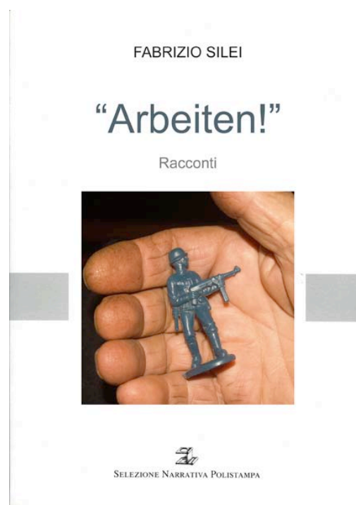
la coperta del libro

prigionieri italiani reduci dai lager nazisti e le loro storie divenute racconti. Racconti di speranza, di solidarietà, racconti di pace oltre gli schieramenti degli eserciti e della politica. Racconti che senza retorica, con una sincerità contadina e fanciullesca, demoliscono lo stereotipo del nemico riposizionando il bene e il male al loro posto, in una filosofia semplice quanto efficace.